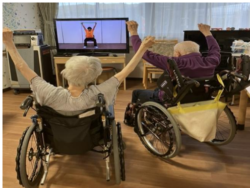
パーキンソン体操