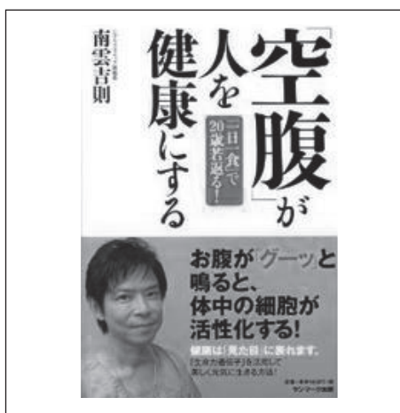
図1：南雲吉則氏の本

私は朝食をとらず、昼食はおかずだけ、夕食は普通でアルコール少々のある生活をしています。私は食事の回数を減らすほうが続きやすいと思いますが、いかがでしょうか。1日3食にして、1回の食事量を少なくするか、1回当たりの食事量が増え、少し吸収されやすくても1日1食または2食にするか、その人その人が、自分で続けやすい方法を選ぶのが良いと思います。